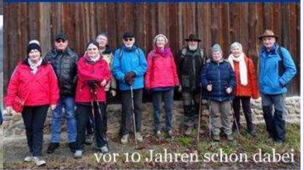
vor 10 Jahren schon dabei

die meisten (35) Teilnehmende waren am 19.01.2020 dabei