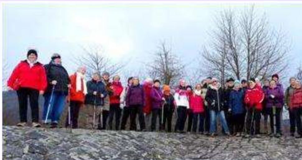
123. "Aus-Gehen" -Wdg.