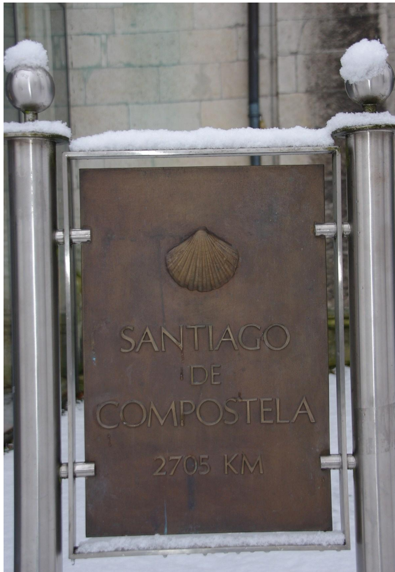
Wegtafel bei der Jakobskirche in Regensburg