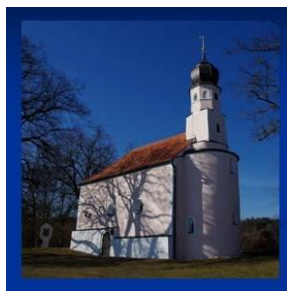
St. Ulrich Tiefenthal

Hinweis: Auch nur am Vm od. Nm möglich (Pkw-Umsetzung)