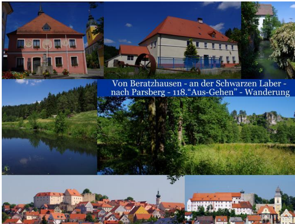
Von Beratzhausen - an der Schwarzen Laber - nach Parsberg - 118. „Aus-Gehen“ - Wanderung