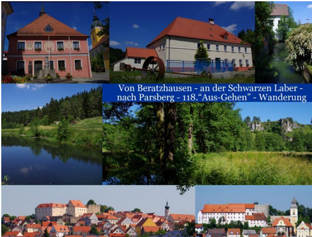
Von Beratzhausen - an der Schwarzen Laber - nach Parsberg - 118. „Aus-Gehen“ - Wanderung