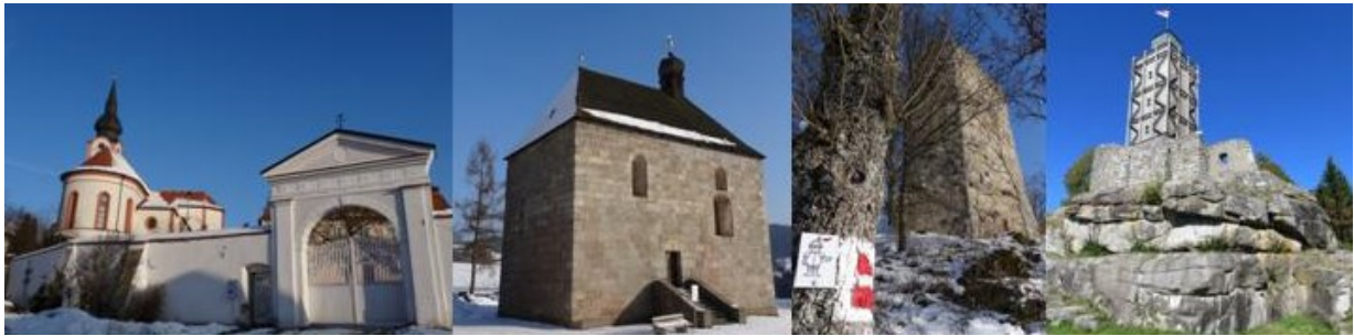
St. Nikolaus – Altenthann