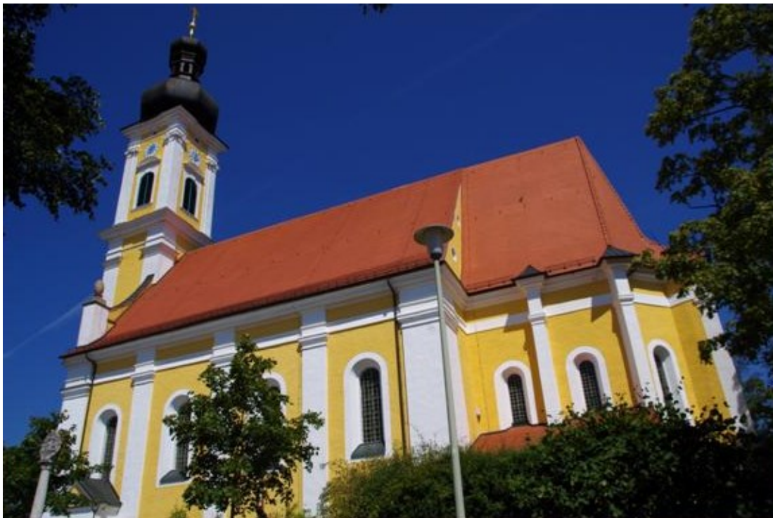
Wallfahrtskirche Hl. Dreifaltigkeit - Eichlberg

Der Rundweg geht von Tiefenhüll (LK R) über den Eichlberg nach Herrnried (LK NM). Nach dem Mittagsessen wandern wir weiter den Rundweg zurück zum Ausgangspunkt.