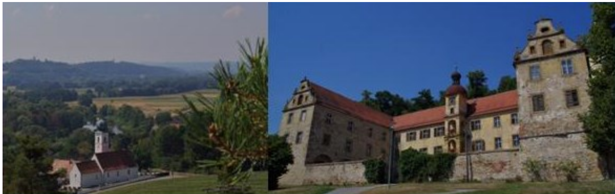
St. Martin – Premberg

Einkehr: http://www.gasthofdreikronen.de/gasthof/index_gasthof.htm