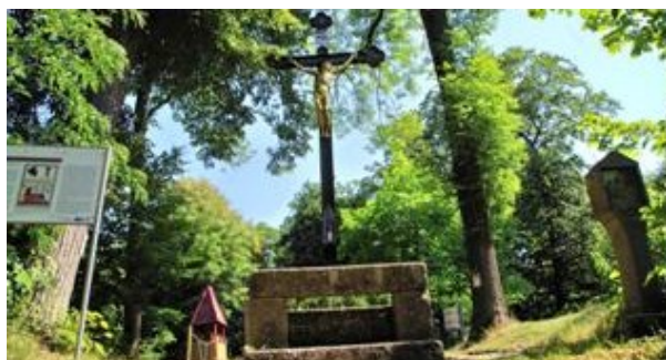
Kreuzweg am Schlossberg in Regenstauf

Einkehr: Mittag: GH Ramspauer Hof Tel. 0 94 02 45 60 Essenabfrage vor Wanderbeginn http://www.ramspauer-hof.de